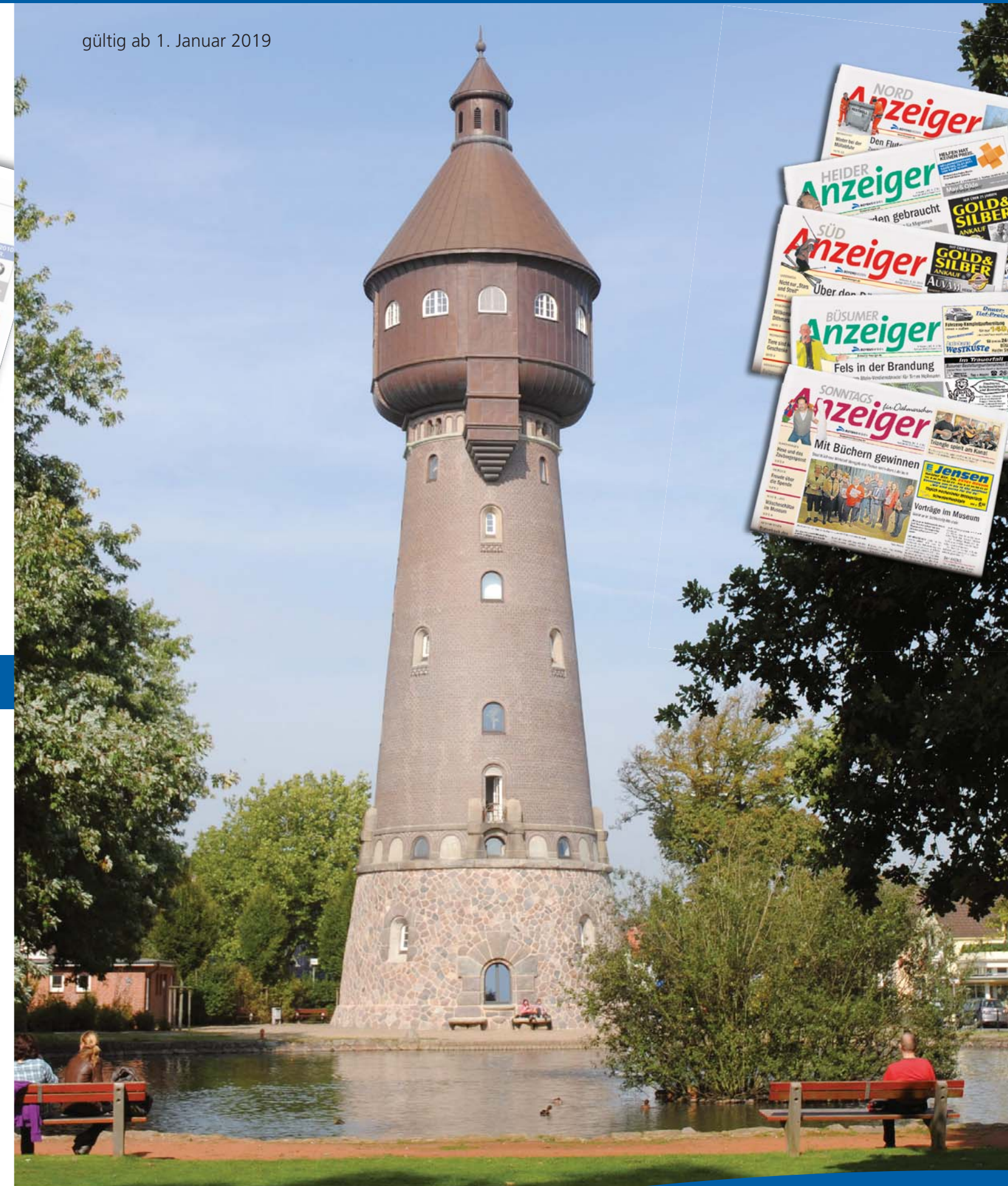
Bekanntes Wahrzeichen: Der Wasserturm in Heide.