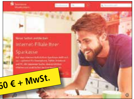
Der neue Internet-Auftritt der Sparkasse überzeugt mit Übersichtlichkeit und einem hohen Sicherheitsniveau.

Auch wenn die Angebote der digitalen Sparkassen-Welt immer weiter ausgebaut werden, wird die personenbesetzte Sparkassen-Filiale vor Ort der Dreh- und Angelpunkt bleiben. „Die Angebote werden immer weiter zusammenwachsen. Ob online, per Telefon oder in der Filiale: Uns ist es wichtig, dass uns unsere Kunden auf dem Weg erreichen können, der für sie in der jeweiligen Situation am einfachsten ist. Unsere neue Internet-Filiale ist dabei eine ideale Ergänzung“, betont Achim Thöle abschließend. Wer bis jetzt noch kein Online-Banking-Kunde der Spar-