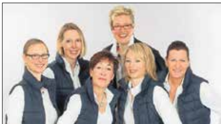
Das Vitalcentrum-Team freut sich auf Sie!