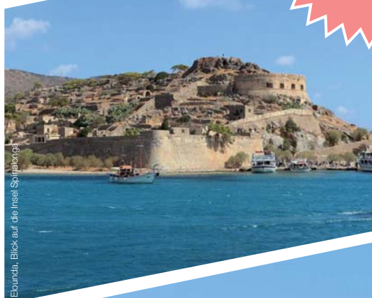
Ebounda, Blick auf die Insel Spinalonga