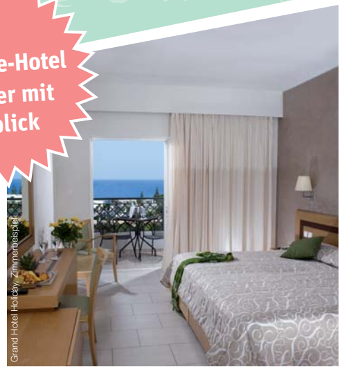
Grand Hotel Holiday, Zimmerspiegel