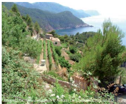
Banyalbufar, Terrassengärten

Diese Reise ist für Reisende mit eingeschränkter Mobilität nur bedingt geeignet.