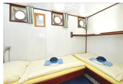
2-Bett Kabine, ebenerdige Betten

Die MS Jan van Scorel verfügt über 4 Zweibettkabinen mit zwei unteren, ebenerdig versetzt stehenden Betten und 5 Zweibettkabinen mit einem erhöht stehenden Bett, so dass sich die Betten an den Fußenden überschneiden, sowie 1 Kabine mit französischem Bett (als Einzelkabine).