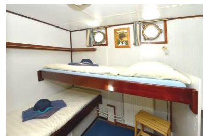
2-Bett Kabine, ein Bett erhöht